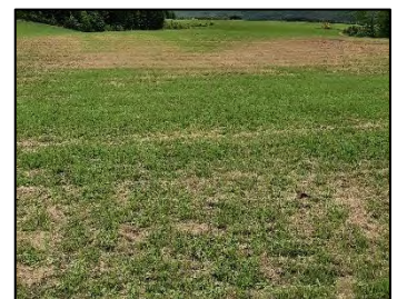
Figure 2 : Prairies affectées par les tipules

Pour en savoir plus sur les services-conseils offerts sur la tipule des prairies, contactez le Club agroenvironnemental de l'Estrie à club-info@cae-estrie.com ou au 819 820-8620.