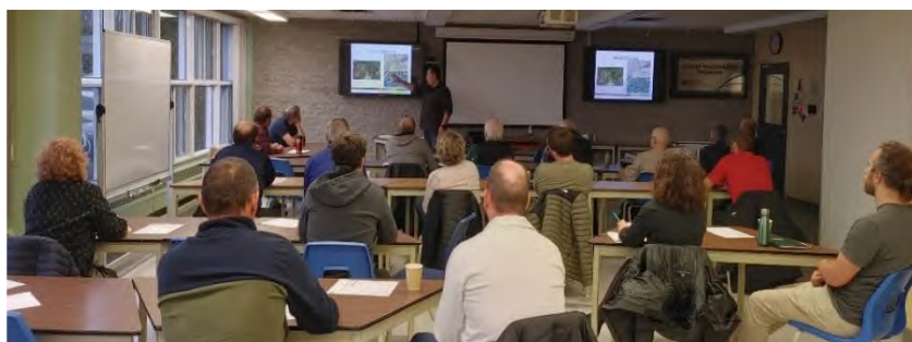
Groupe de producteurs à Coaticook, lors de la formation cours d'eau en 2022

Soulignons également que le projet Viande solidaire orchestré par le Centre d'action bénévole et le Syndicat local de l'UPA de Coaticook est aussi en nomination pour un prix.