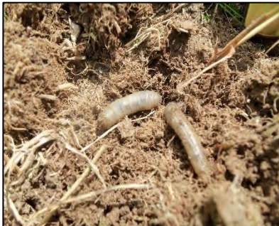
Figure 1 : Tipule des prairies au stade larvaire

En septembre, les adultes émergent du sol, s'accouplent, pondent et meurent. Les premiers stades larvaires ont lieu à l'automne (figure 1), les larves s'enfoncent dans le sol pour passer l'hiver à l'abri du gel. Au printemps, elles remontent pour s'alimenter des racines de cultures en place.