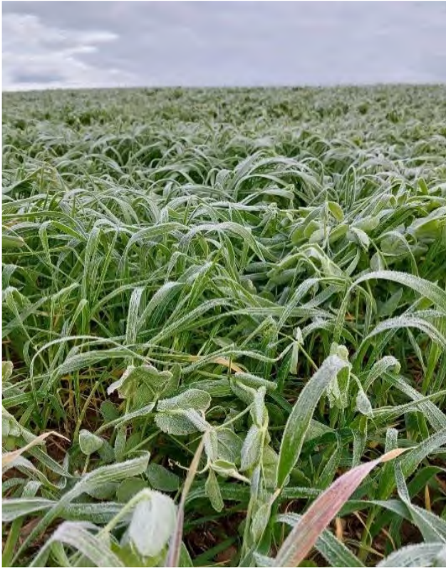
Un bon couvert végétal vous protège contre l'érosion durant l'hiver.