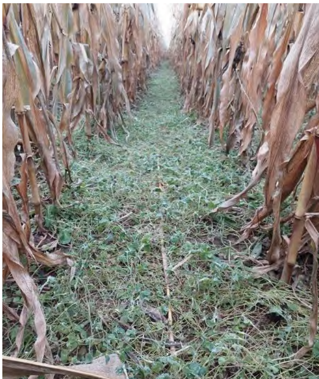
Culture intercalaire dans le maïs.

L'hiver semble finalement s'installer, mais le moins qu'on puisse dire, c'est que les saisons se suivent et ne se ressemblent pas d'une année à l'autre. Avec les conséquences des changements climatiques et le mercure qui se paie un tour de montagnes russes dans nos thermomètres, il devient difficile de prévoir la météo à long terme.