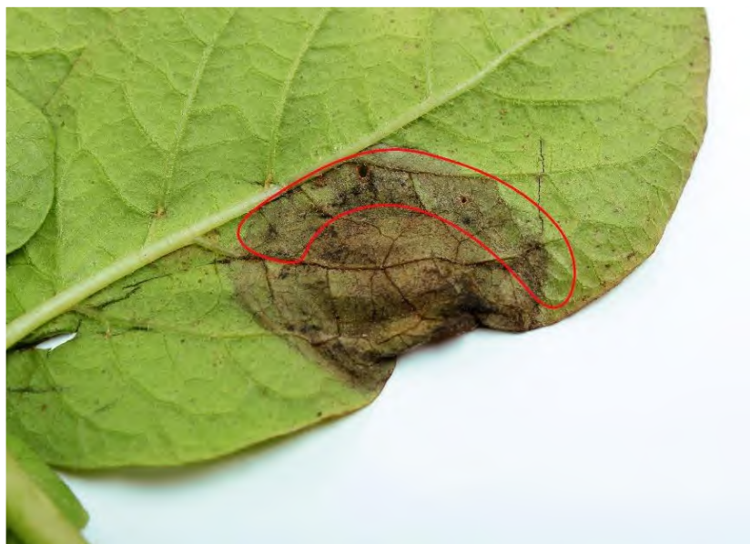
Mycélium blanc se développant à la marge des taches, sur la face inférieure de la feuille

En cas de doute au cours de la saison 2024, nous vous invitons à contacter un agronome de la direction régionale du MAPAQ. Des échantillons de feuillage ou de tubercules pourront être analysés par le Laboratoire d'expertise et de diagnostic en phytoprotection du MAPAQ. Nous vous suggérons aussi d'informer les voisins qui cultivent des pommes de terre et des tomates pour qu'ils vérifient l'état de leur culture et prennent les mesures nécessaires.