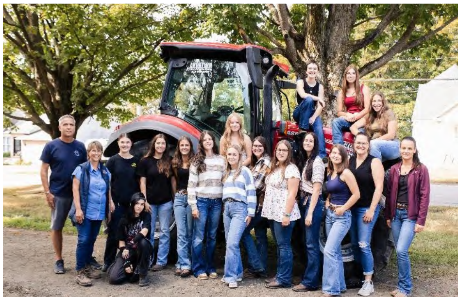
Groupes d'élèves de 2 e année à la concomitance en Production animale. Un groupe entièrement féminin et une relève qui promet!

Plusieurs programmes sont désormais offerts dans cette formule au CRIFA. Une formule qui attire les jeunes à faire ce qu'ils aiment et qui les encourage à terminer leur parcours scolaire au secondaire.