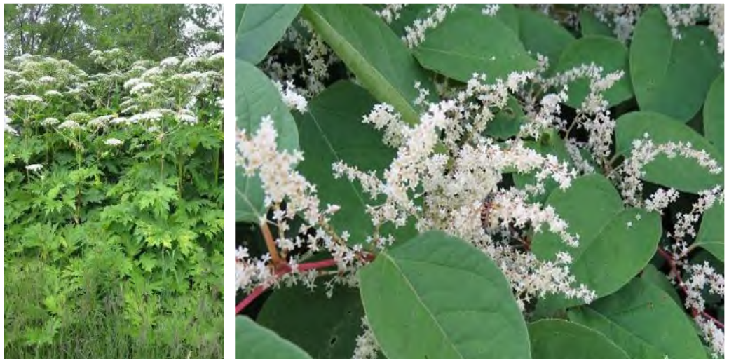
Berce du Caucase et renouée du Japon.