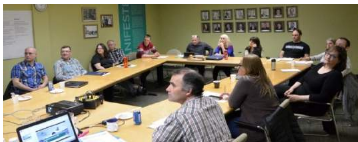
Le groupe de travail en action le 1 er mai dernier

Entre temps, vous souhaitez en connaître davantage sur les changements climatiques et leurs impacts? Consultez l'un des six webinaires qui seront rendus disponibles en vous rendant au agriclimat.ca .