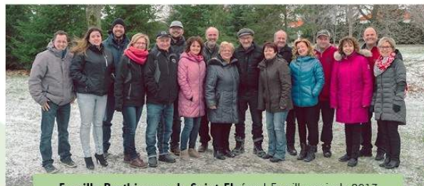
Famille Berthiaume de Saint-Elzéar | Famille agricole 2017

Courez la chance de devenir la 62 e famille agricole!