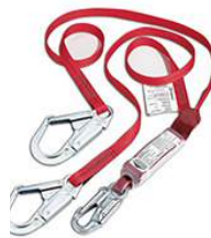
Choix # 2