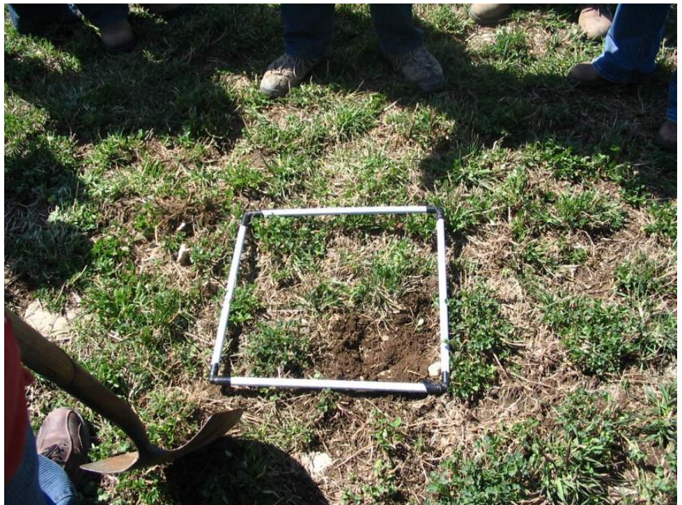
Photo d'un quadrat prise lors d'un constat de population.