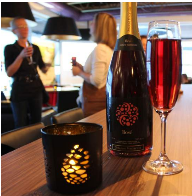
Le vin mousseux du Domaine Bergeville