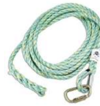
Choix # 3