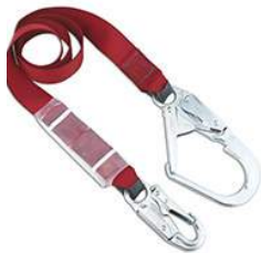
Choix # 1