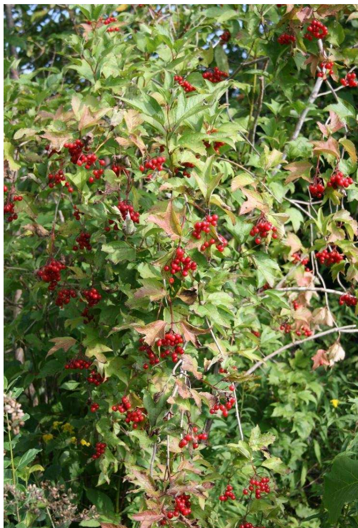
Viorne trilobée

Ce projet répond aux objectifs du programme de certification forestière du SPFSQ ayant pour but de renforcer l'économie locale par la diversification des usages et produits de la forêt. Les partenaires régionaux qui se sont distingués par leur contribution au projet sont l'Agence de mise en valeur de la forêt privée de l'Estrie, la MRC de Coaticook, la MRC des Sources ainsi que Cultur'Innov.